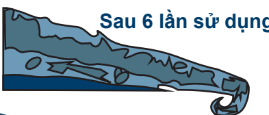
Sau 6 lần sử dụng