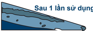
Sau 1 lần sử dụng